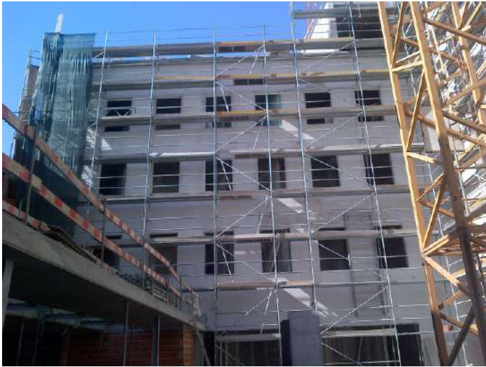
1- Fase inicial