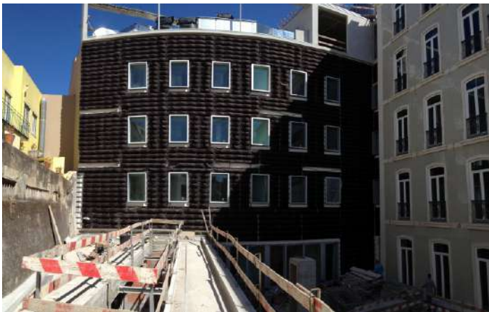
2- Fase intermédia